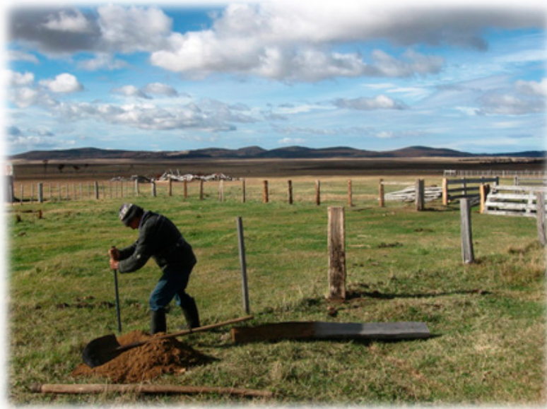
Fig. 5. Alambrados en Estancia Vicuña

De acuerdo a lo planteado por Díaz, Contardi & Cía. (1920), el origen de los alambrados en la región de Magallanes se sitúa en 1883: