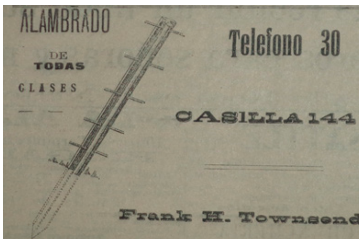
Fig. 3. Aviso comercial