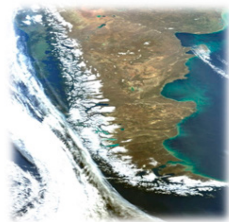
Fig. 1. Fotografía satelital territorio Patagónico 2

El territorio ubicado en el extremo sur de América, conocido como la Patagonia, se enmarca dentro de los territorios actuales chileno-argentinos, con una frontera geopolítica delimitada entre ambos gobiernos y reconocida oficialmente por los mismos como legítima, según Martinic (1971) que: “tras la sanción jurídica de la ocupación de la Patagonia el 23 de julio de 1881, suscrito en Buenos Aires por el Cónsul General de Chile Francisco de B. Echevarría y el Ministro de Relaciones Exteriores argentino Bernardo Irigoyen” (p. 226); si bien la Patagonia es una sola, para ambos Estados existen diversos límites territoriales de lo que es Patagonia propiamente tal: en Argentina comprende las provincias de Río Negro, Neuquén, Chubut y Santa Cruz; en Chile se entiende la Patagonia desde el seno de Reloncaví, incluyendo las regiones de Aysén y Magallanes.