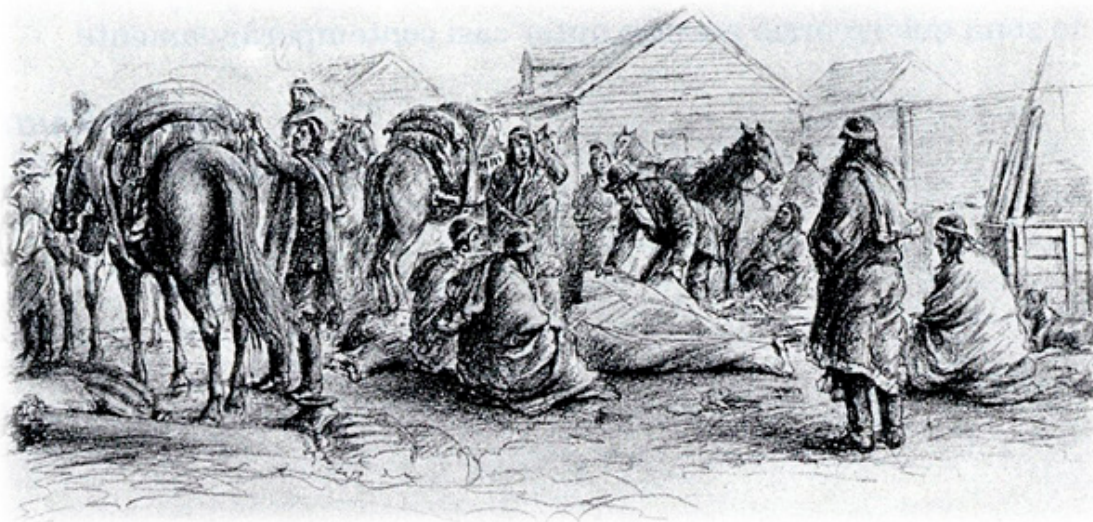
Fig. 2. Grupo de Aónikenk intercambiando productos en Punta Arenas. (Dibujo de Ohlsen, 1884)

entre occidentales y patagones; como señala Martinic (1995) con respecto al intercambio comercial, “(...) del evidente interés que manifestaban por el intercambio, los indígenas sabían mantener una compostura sorprendente para quienes, de primera, eran tenidos como gente bárbara” (p. 97).