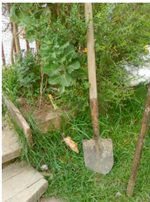
Fig. 4. Pala Punteadora

En la región de Aysén, la ganadería se desarrolla con aspectos similares a Magallanes, por lo que las actividades que se desprenden son las mismas, tales como la esquila, albañilería o el alambrado; Pomar (1923) se refiere a las características del alambrado, las cuales son similares a las descritas por el alambrador Ovando: “los alambrados, ejecutados con 7 hilos de alambre liso con postes distanciados de 12 m con 7 piquetes intermedios” (p. 45). Martinic (2005) realiza una acotación con respecto al alambrado en los campos ayseninos: “La infraestructura productiva se había completado a satisfacción, incluyendo el oneroso trabajo de alambrado de los campos, cuya extensión superaba en 1913 los 400 kilómetros (p. 139).